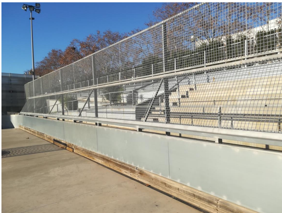
Vista de la tanca darrera porteries que s'ha de suplementar fins a una alçada de 5 m.