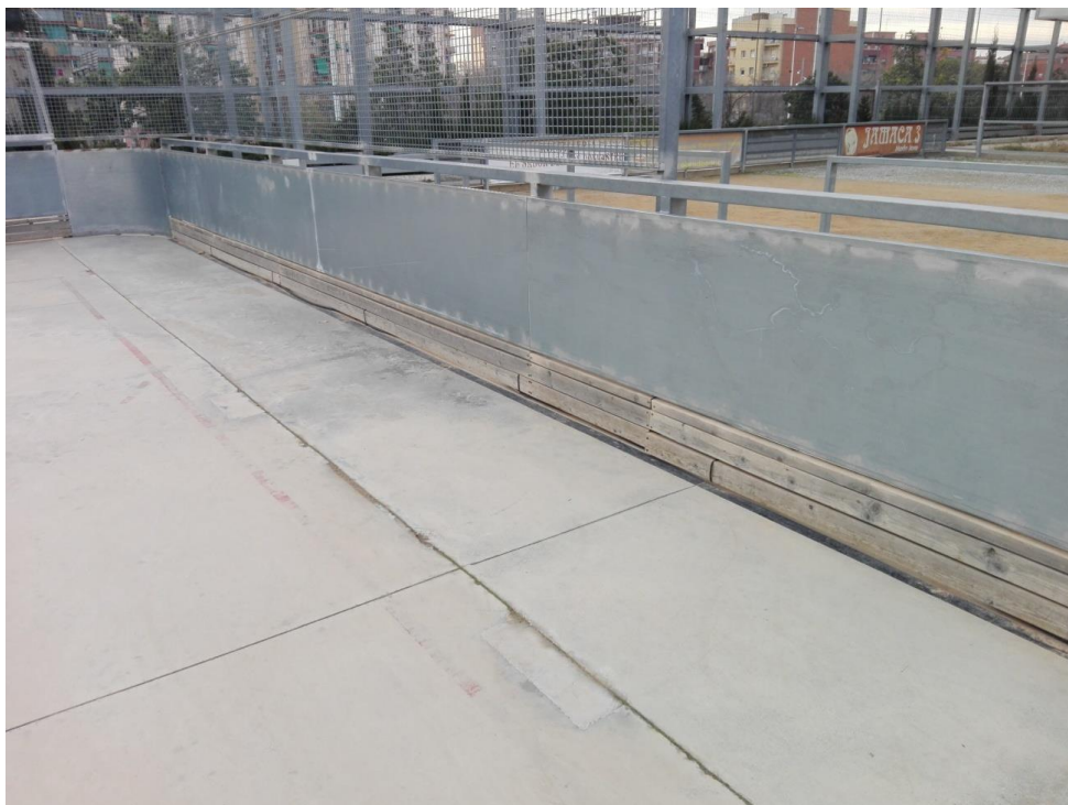
Vista de l'estat de la pista i la tanca perimetral.