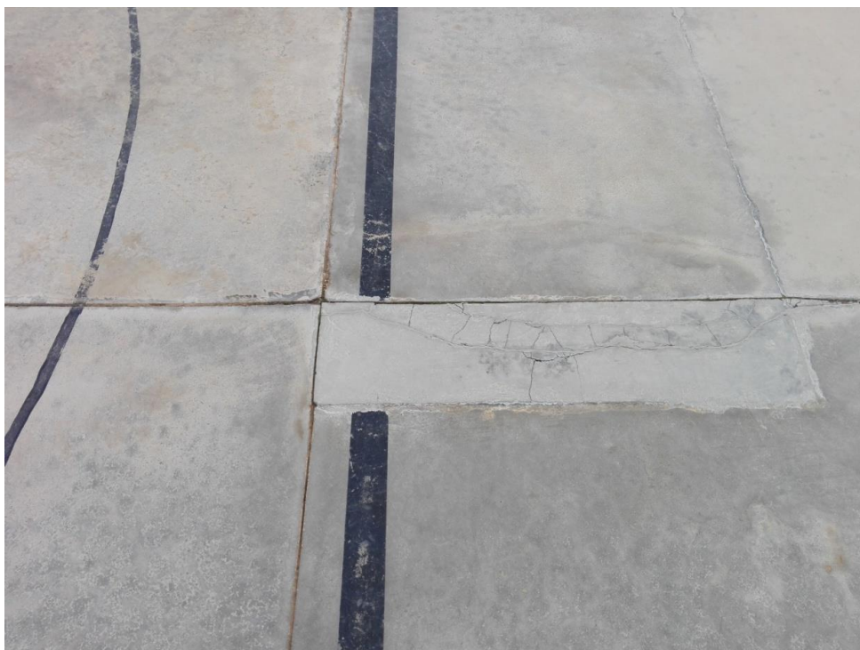
Vista de l'estat de la pista.