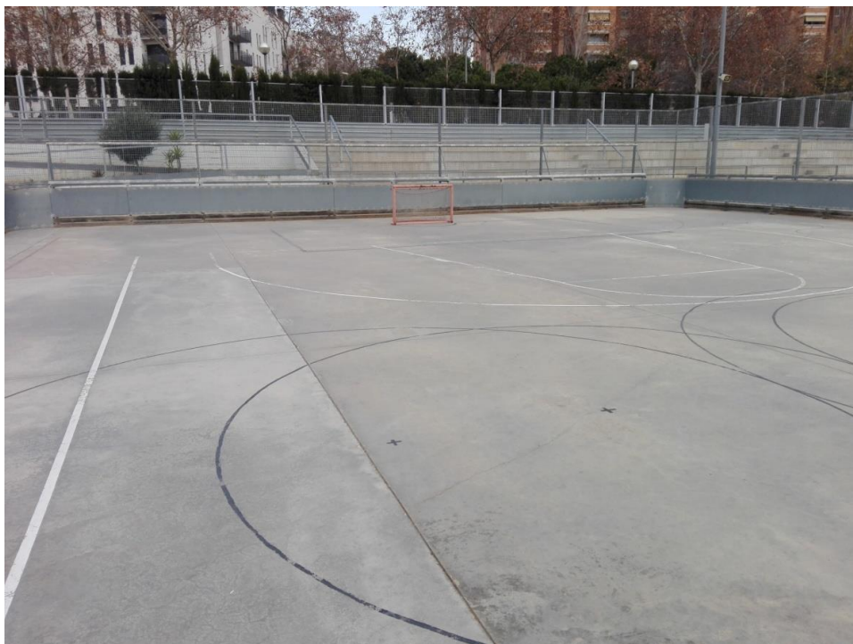
Vista general de la pista.